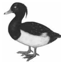
Polák chocholačka ( Aythya fuligula )