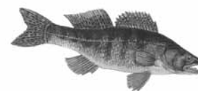
Candát obecný ( Stizostedion lucio-perca )