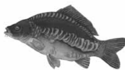
Kapr obecný ( Cyprinus carpio )