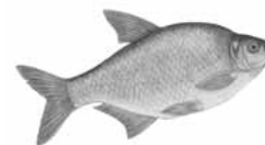
Cejn velký ( Abramis brama )

Park narodowy Stawy Lanškrounskie leży na obszarze układu sześciu stawów na Potoku Ostrovským. Przez park prowadzi ścieżka dydaktyczna. Staw Długi oferuje szerokie możliwości zakwaterowania i sportów wodnych, zaś pozostałe stawy ciche miejsca do wędkowania.