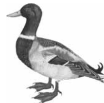
Kachna divoká ( Anas platyrhynchos )

Zadavatel: Lanškrounsko, dobrovolný svazek obcí; nám. J. M. Marků 12, 563 01 Lanškroun Naučná stezka byla realizována za finanční spoluúčasti Pardubického kraje. Investor: Město Lanškroun, +420 465 385 111 Text: Mgr. František Teichman, Lanškroun Kresby: Leona Melicharová, Lanškroun Projekt a realizace: REDEA s.r.o., Žamberk, +420 603 874 843 Návrh panelů a grafického zpracování: Mgr. Miloš Krejčí, Lanškroun, +420 603 182 523 Výroba stojanů a mobiliáře: KČT Horal Ústí nad Orlicí, +420 603 772 985 Tisk: Pavel Kráčmar - RECAL, +420 465 322 367, Lanškroun