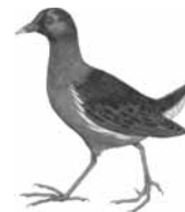
Slíпка zelenonohá ( Gallinula chloropus )