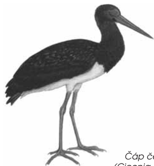
Čáp černý ( Ciconia nigra )

Areál Lanškrounských rybníků dnes prochází velkou proměnou. Náhrdelník Lanškrounských rybníků je vzácným klenotem celého regionu.