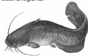
Sumec velký ( Silurus glanis )