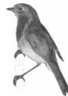
Červenka obecná ( Erithacus rubecula )