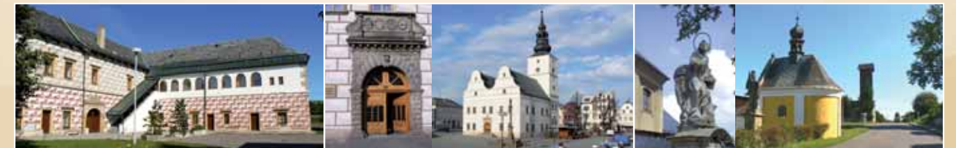
► Zámky a muzea Lanškrounska