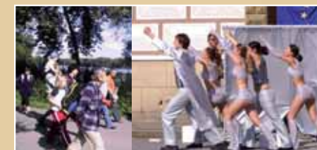
► Kalendář akcí 2008